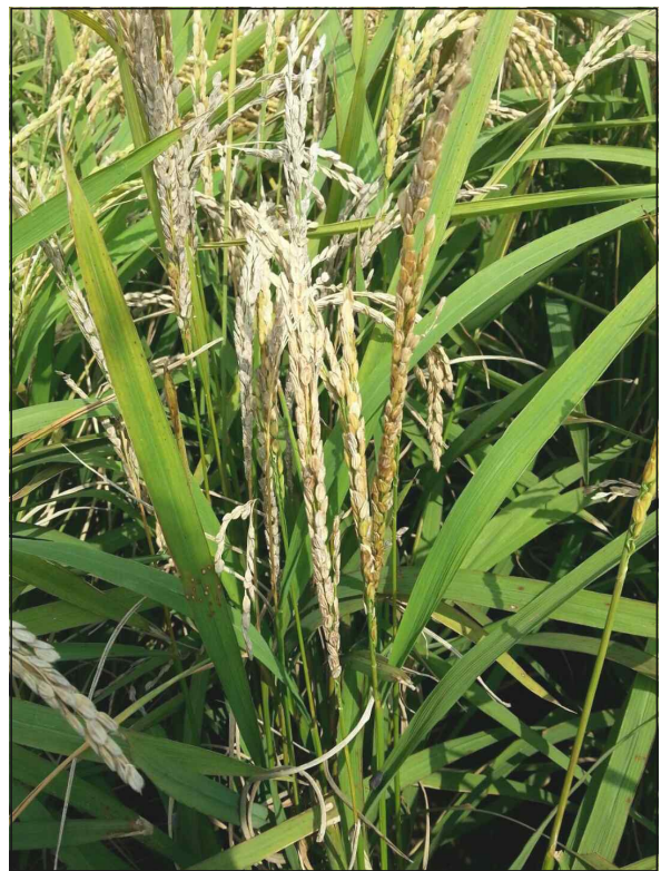
【먹노린재 피해 이삭】