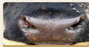
주둥이 및 입술의 궤양성 병변