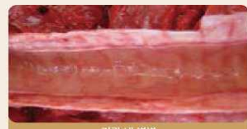
기관 내 병변