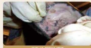
구강 내 궤양성 병변